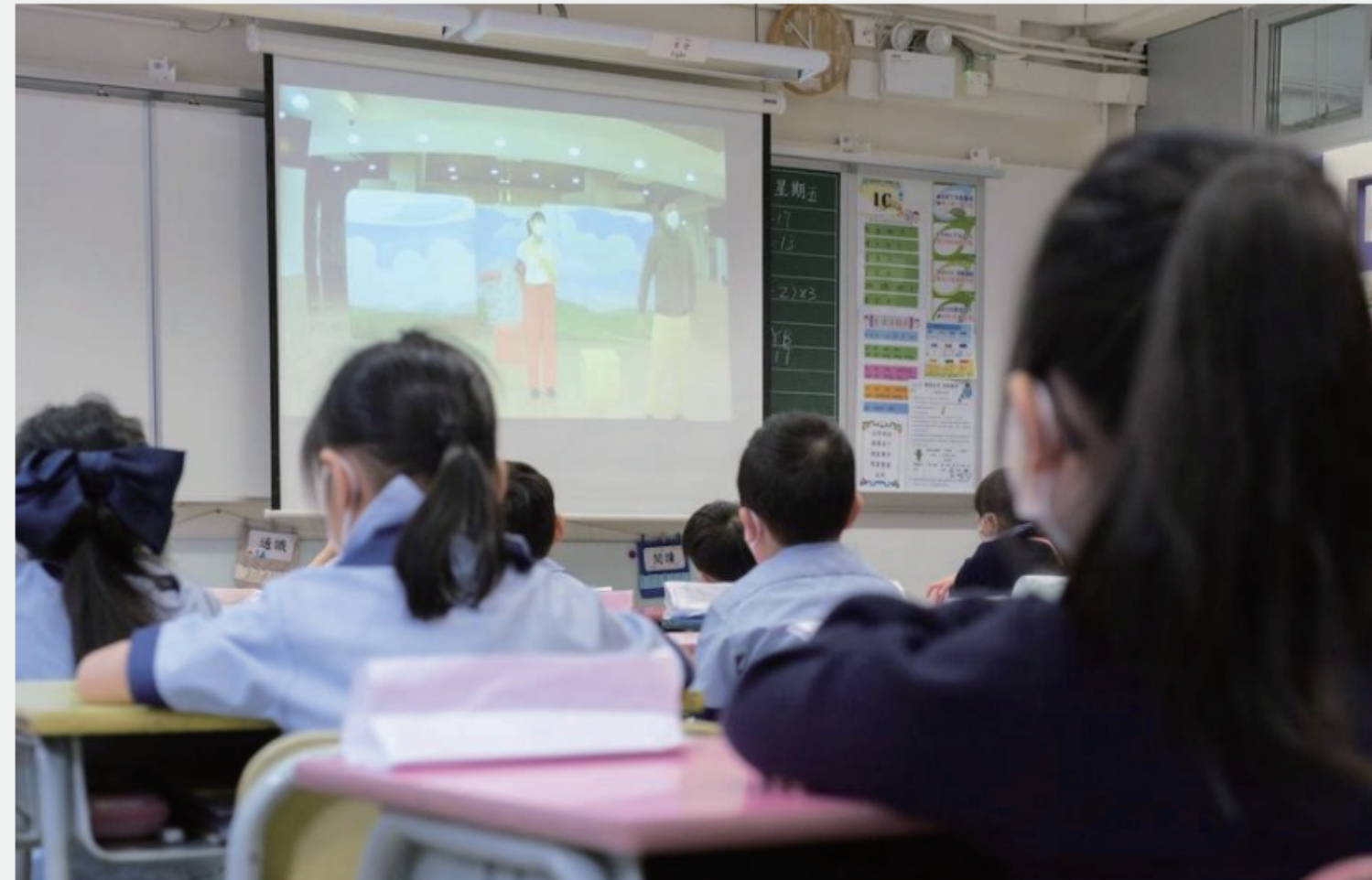
▲ 學生在課室觀看劇團演出

大細路劇團希望有一個更全面的計劃，因此「童行戲劇」分上、下兩集的劇場表演，像是一個首尾呼應。在校內首次演出時，讓師生能欣賞專業的戲劇表演，同時希望他們認識計劃後，吸引一些有興趣的同學參與。其後的學生工作坊以創作性戲劇的方法，由導師引導，與學生共同創作故事下集的部份內容，最後與劇團演員共台演出數分鐘。然而，這並不是把學生在培育成演員，而是在過程中鼓勵學生發揮創意、建立正向人生觀等。